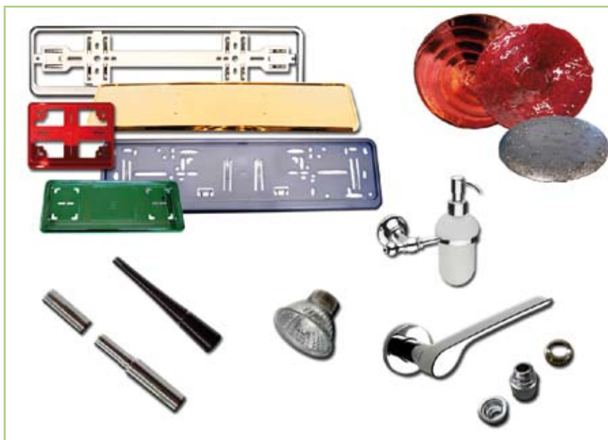
7 - Alcune lavorazioni e finiture su plastica, vetro e ferro.

1977. Inizialmente si pone sul mercato come azienda specializzata nello stampaggio di materie plastiche e costruzione stampi. Oggi l'azienda si è specializzata a livello mondiale nella produzione di porta-targhe per il mercato tuning e racing (fig 7). Da subito si rende conto che è vincente offrire alla clientela la possibilità di vedere sviluppata la propria idea da un unico interlocutore che possa velocizzare i processi e tutelare la riservatezza della realizzazione e garantire la qualità finale. Da qui l'inserimento di un centro di lavoro ad alta tecnologia, alla realizzazione CAD-CAM di rendering, costruzione stampi, test produttivi, stampaggio materie plastiche, finiture estetiche con relativo studio di grafica packaging ed eventuale consegna. Nel corso degli anni lo sviluppo dell'attività di trattamenti superficiali dei materiali, come verniciatura, laccatura, e metallizza-