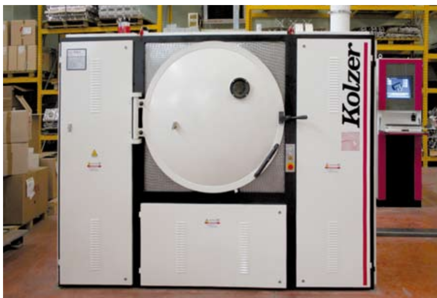
3 - Una macchina per lo sputtering, una tecnologia alternativa alla metallizzazione tradizionale, che la Maxpla sta testando per abbattere l'impatto ambientale delle proprie attività di finitura.