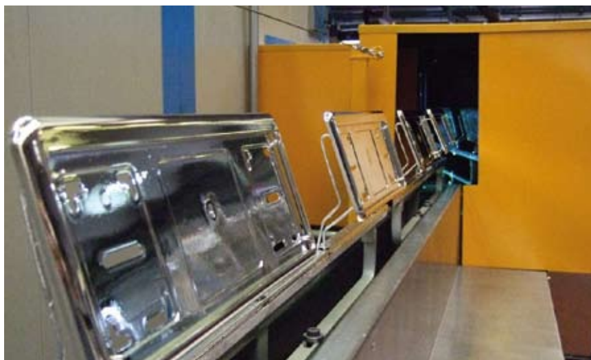
10 - I pezzi verso la fase di polimerizzazione in forno UV.