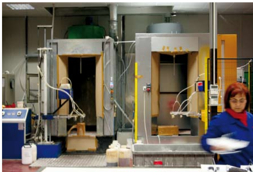
4 - Le cabine di verniciatura dei manufatti plastici. La fase di verniciatura per Maxpla è un processo difficile, poiché coinvolge nella maggior parte dei casi la sola parte interna del manufatto.