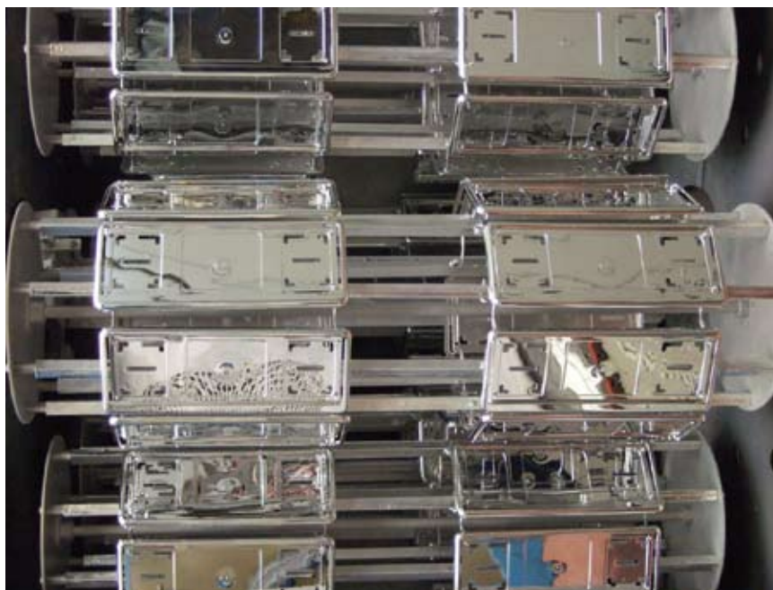
9 - Particolare di pezzi durante la fase di metallizzazione.